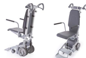
ScalaMobil equipado com Scalachair X3