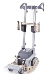
1521111 + 1520414