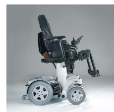
1030 / 1040