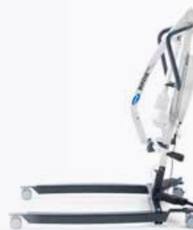
Birdie EVO Versão premium

O tamanho reduzido do Birdie EVO Compact permite executar manobras de forma fácil em espaços reduzidos. Dobrável e com abertura de pernas manual. Disponível com barra de cesta de 2 pontos ou 4 pontos. Fornecido com cesta standard.