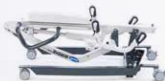
Birdie EVO COMPACT

Versão melhorada do líder de mercado Birdie, desenvolvida para possibilitar transferências seguras, tanto em ambientes institucionais como domiciliários. Dobrável e com abertura de pernas manual. Disponível com barra de 4 pontos. Fornecido com cesta standard.