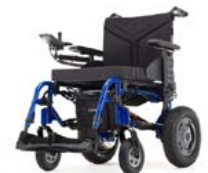
Esprit Action 4 - Versão Adulto