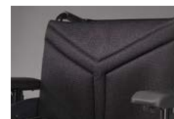
Novo tecido de Encostos